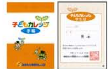
子どもカレッジコース