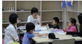
学習タイムの様子

これは、「青少年異年齢交流モデル事業『寺子屋ありす』（以下、寺子屋）の一角です。