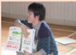
大学生によるプレゼンテーション