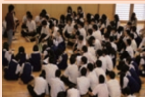
真剣に耳を傾ける高校生