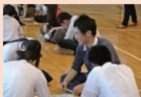
対話を通じて将来を考える