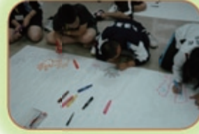
未来予想図の作成 目標と、すべきことを確認しよう