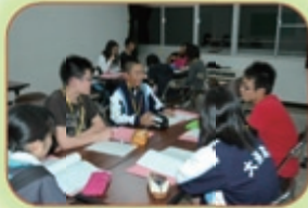
ゲームでコンセンサス （合意形成）を学ぼう