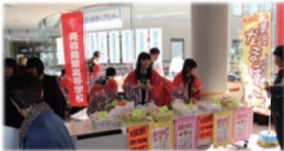
売り切れ続出 青森商業かまぼこ販売

各参加校が食品加工品の販売をするほか、木工作業等の体験ができます。また、生徒研究についてのパネル展示をご覧ください。