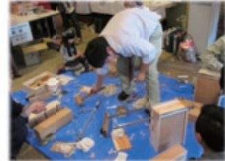
大人気！南部工業整理箱&はし製作実習